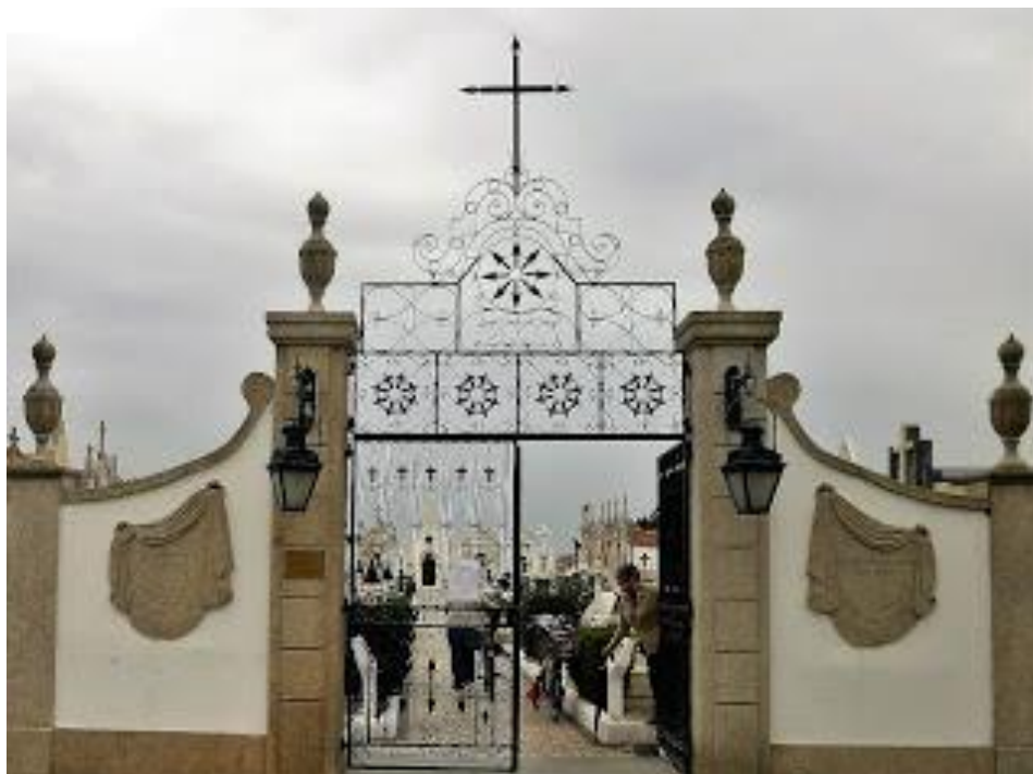
Fotografia 1 - Portão do Cemitério, Singela Homenagem aos Nossos Ente Queridos

No dia 19 de março, contrariados, fechamos o Cemitério, apesar de ser o dia do Pai. Mas a nossa determinação na salvaguarda dos interesses dos Cidadãos, falou mais alto do que o sentimento que a muitos nos levaria ao Cemitério naquele dia.