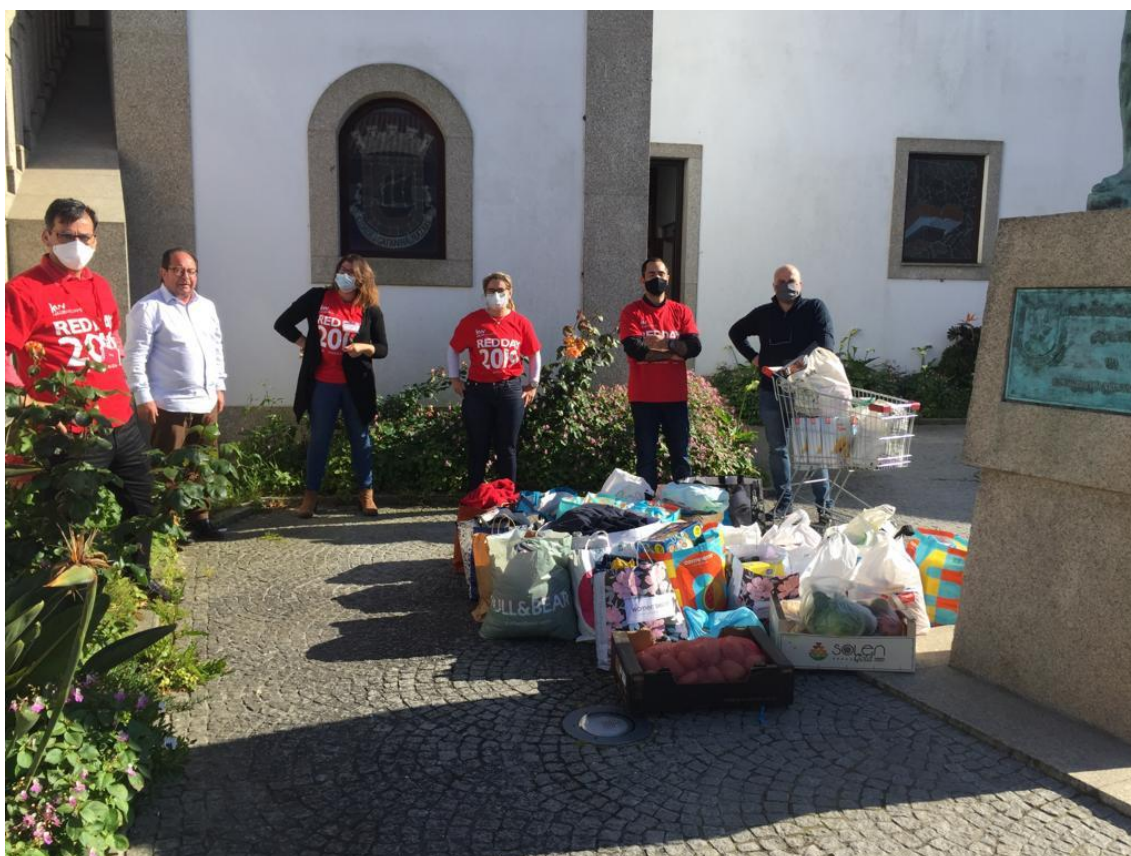
Fotografia 5 – Entrega de Material à Cáritas pela Empresa KWALFA

Quando a Cáritas precisou mais, (precisa sempre) estivemos na primeira linha de apoio, para minimizar os impactos negativos que o aumento de apoios provocou nos bens essenciais, que deixou de ter para entregar às famílias que deles necessitavam. Estivemos na campanha de angariação de géneros alimentícios e não só para a Cáritas, quando aceitamos o desafio da empresa KWALFA, na escolha da Instituição a quem iria entregar o resultado da sua recolha anual, para entrega a uma Instituição.