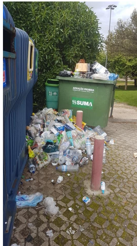
Fotografia 10 - Aspecto do Jardim Oudinot

A Vergonha e o despudor de alguns, continua. Nos locais mais escondidos, nos locais mais à vista, nos locais menos prováveis e nos locais mais emblemáticos. Alguns cidadãos preferem trocar o que o bom senso recomenda e as condições oferecem e permitem, para sujar e deixar o que ainda poder ser reciclado no espaço público, à vista de todos, sujeitando-nos aos malefícios de tal degradação. O respeito pelos outros, começa onde acaba o cada um e numa sociedade que se diz evoluida, há coisas que não fazem sentido nenhum. Apesar das campanhas, apesar dos apelos, apesar de sermos uma EcoFreguesia, há ainda quem teime e não se querer comportar como um cidadão responsável e o grande problema é que na maioria das situações, ajem a coberto da noite. Lamentável.