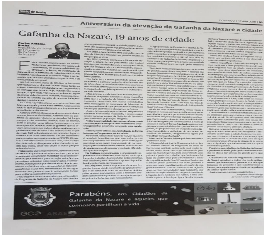
Fotografia 8 – Publicação no DA, dia da Elevação a Cidade.

Tudo teve de ser cancelado. Cancelado, mas não esquecido, porque fica aqui a promessa solene de no próximo ano de 2021, havendo condições, recuperaremos o gosto perdido destes dois últimos anos. Seguramente que envolveremos as Associações, os Cidadãos e honraremos a data e quem foi promotor dela mesmo.