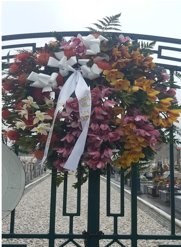
Fotografia 6 – Flores colocadas nos Portões do Cemitério

Numa atitude de profundo respeito pelos nossos entes queridos que estão sepultados no Cemitério, assinalamos o fim de semana da Páscoa, assim como o dia da Mãe, colocando coroas de flores nas três entradas do Cemitério. Singela, mas sentida homenagem aos que já partiram, que tanto nos dizem e que tanto fizeram para engrandecer o nome da Gafanha da Nazaré.