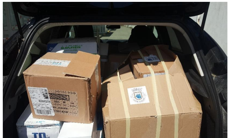
Fotografia 2 e 3 - Entrega de EPI'S nas Instituições