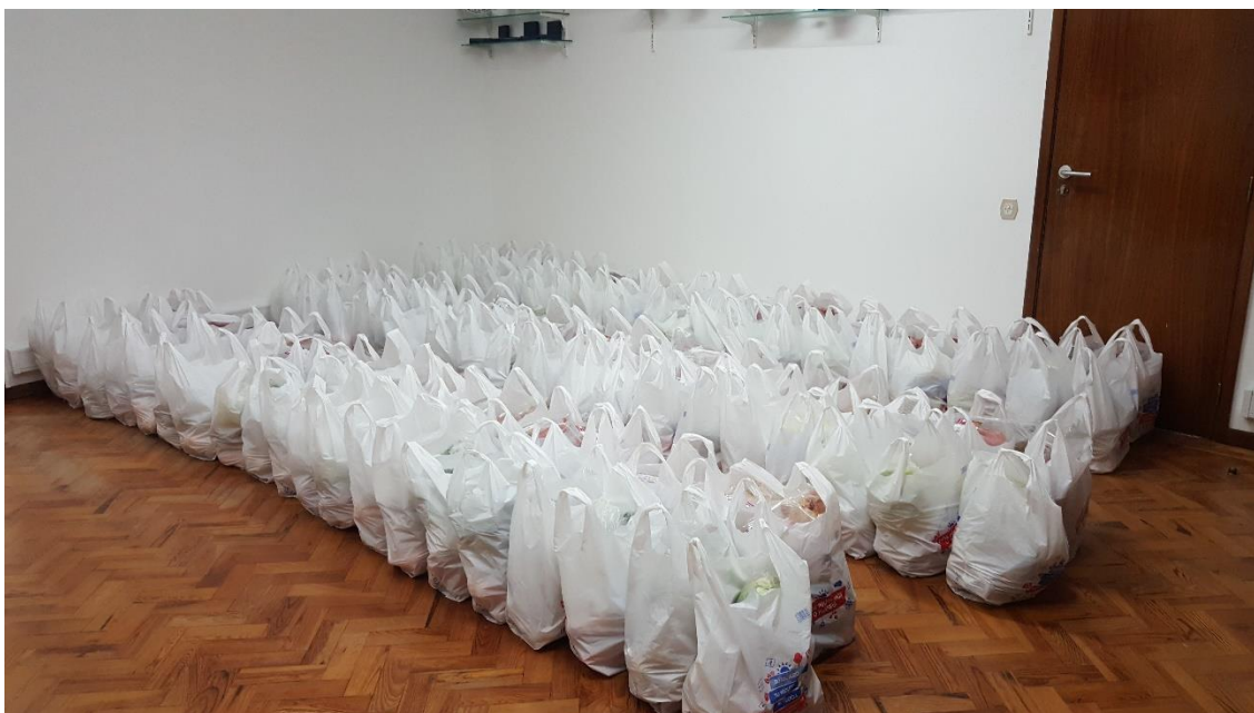
Fotografia 4 - Cabazes entregues aos Alunos das Escolas do Agrupamento da Gafanha da Nazaré

Colaboramos com a Camara Municipal de Ílhavo e com o Agrupamento de Escolas da Gafanha da Nazaré, primeiro na entrega de refeições confeccionadas aos alunos de algumas escolas e que as vinham buscar à Junta de Freguesia, quando mais nada estava a funcionar. Depois numa fase posterior, asseguramos a entrega de cabazes a 71 crianças com alimentação para que pudessem preparar as suas refeições em casa.