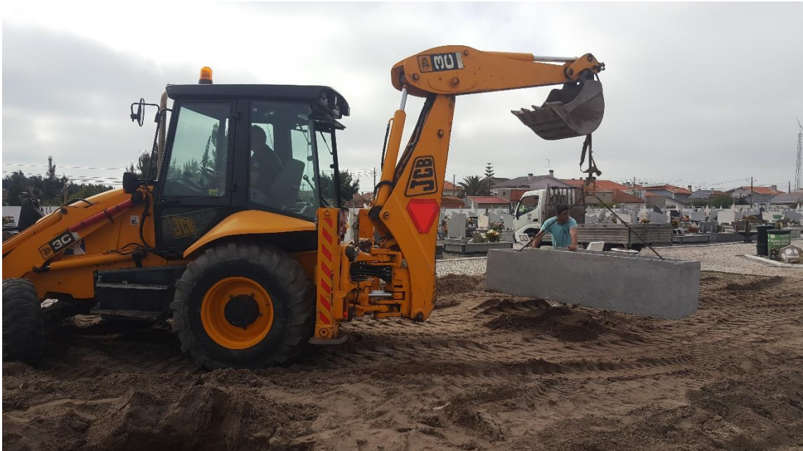
Fotografia 9 – Construção de Campas no Cemitério