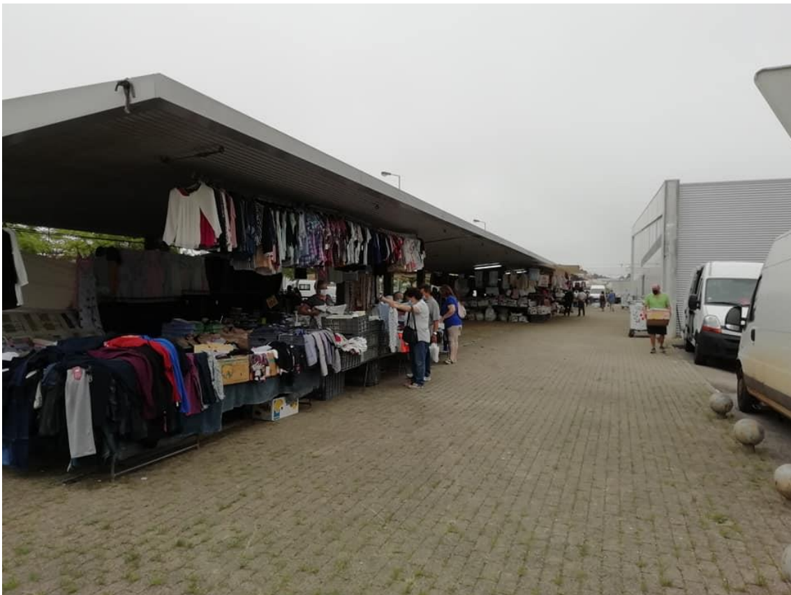
Fotografia 7 - Feira no Mercado da Gafanha da Nazaré

No passado dia 30 de maio de 2020 , uma semana antes do que estava previsto e depois de forte negociação na reunião semanal conjunta, reabrimos a venda no terrado. Também com um conjunto de normativos e de regras adequadas aos tempos que vivemos para todos estarmos em segurança. Todos os comerciantes passaram a vender na zona da Pala Lateral do Mercado, para que se continue a manter o dispositivo montado de acesso ao interior do mercado. De salientar, que as lojas com porta para o exterior do Mercado, mesmo no período de fecho do mesmo, não estiveram fechadas e cumpriram sempre com as determinações da DGS para poderem exercer a sua atividade.