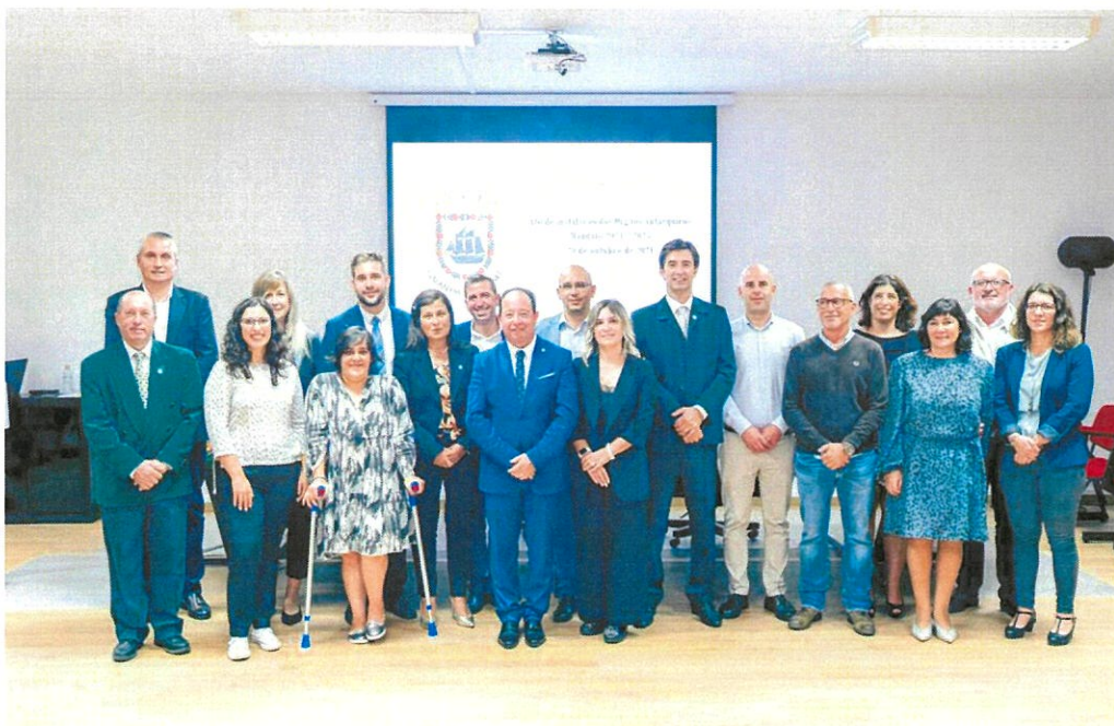
Executivo e Assembleia de Freguesia da Gafanha da Nazaré para o Mandato 2021/2025

No seu discurso de posse, o Presidente reeleito, venceu bem as linhas orientadoras do mandato que pretende ver implementado para a Freguesia e deixou algumas considerações de fulcral importância aos parceiros de governação futura. De salientar o apelo à participação cívica de todos, mostrando abertura para que de forma construtiva se possa trabalhar em conjunto, não para as redes sociais, mas sim para a Freguesia e para os seus Cidadãos. Da Câmara espera e deseja um olhar atento e efetivo na resolução das questões mais prementes da Freguesia.