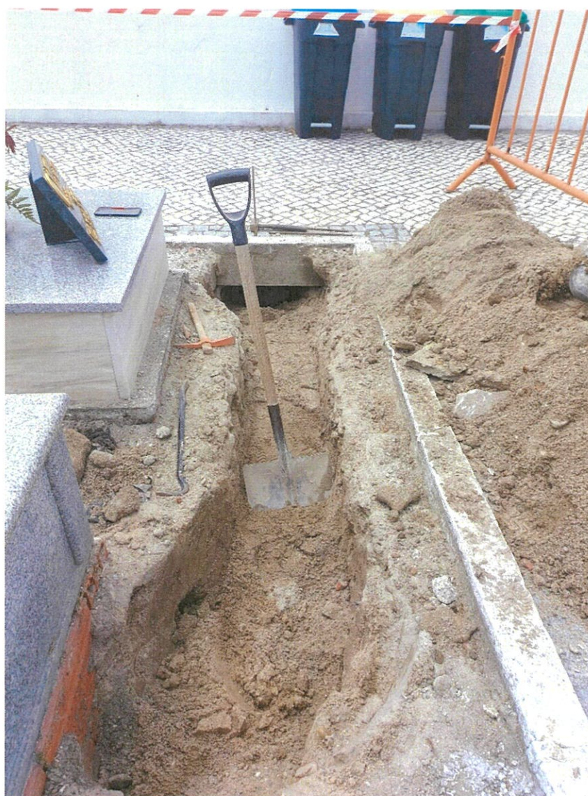
Trabalhos de Manutenção no Cemitério