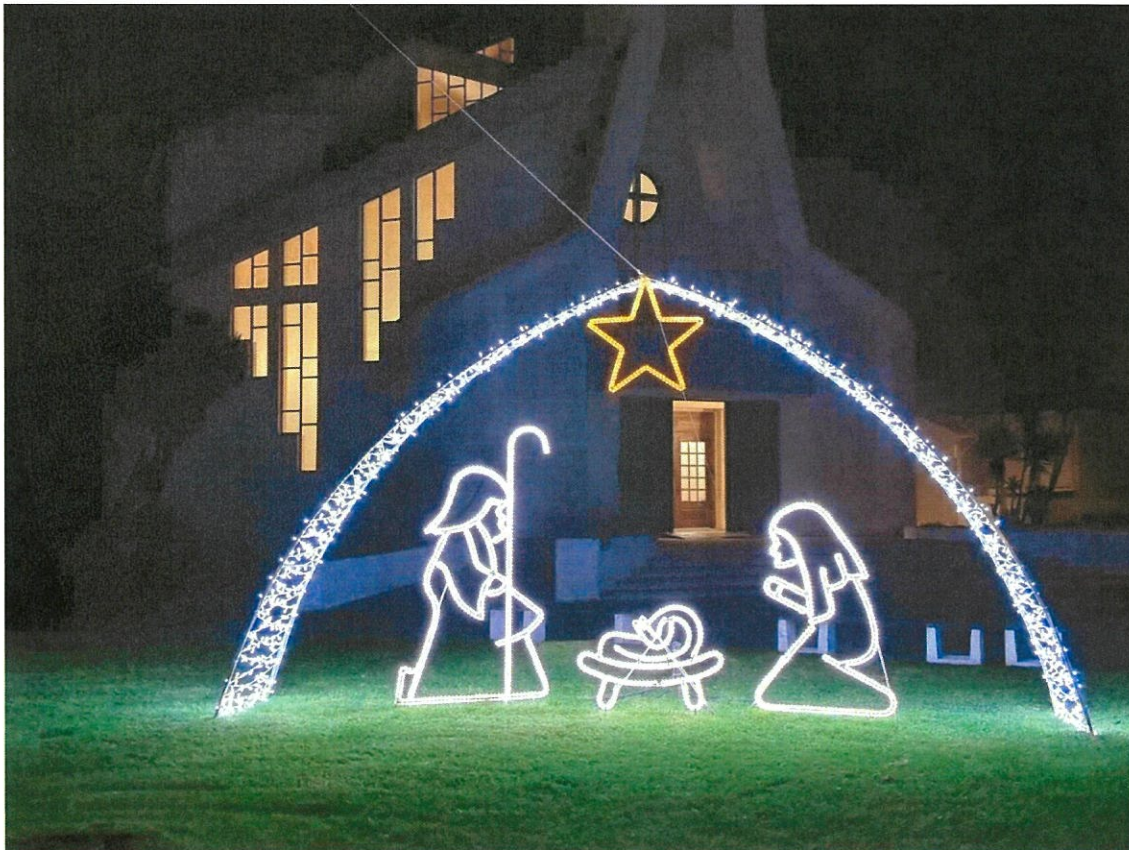
Imagem do Presépio colocada na Praia da Barra

Iluminações de Natal – Pelo segundo ano consecutivo, a Junta de Freguesia leva a efeito, a colocação de alguns adereços alusivos ao Natal. Colocamos 4 Árvores de Natal em vários pontos da Freguesia a citar; na frente da Junta de Freguesia, no Largo do Renovado Cruzeiro, na Rotunda do Forte e na Rotunda no Início da Rua D. Manuel Trindade Salgueiro e em frente da igreja na Praia da Barra, colocamos um presépio. Todas estas iluminações são suportadas pelo orçamento da Junta de Freguesia e contámos este ano, com algumas dificuldades adicionais. Não tivemos a esperada colaboração da Camara Municipal de Ílhavo na cedência das ligações à rede elétrica pública, por não ter autorização da E-Redes, segundo nos informaram, facto que não se verificou no ano passado. Esse foi o fator que nos levou a deslocalizar a estrutura de iluminação da Entrada da Barra, para Junto da Igreja, para que esta nos pudesse fornecer a luz, assim como aconteceu no Largo do Cruzeiro, com a luz a ser cedida por um privado, facto que muito agradecemos. Porque sempre entendemos que a Freguesia não é bem tratada nesta matéria de iluminações de Natal, pese embora o facto de nos primórdios ter sido bem pior, decidimos uma vez mais avançar para este projeto às nossas expensas para dar uma outra vida à Freguesia e outra luz aos Cidadãos desta terra.