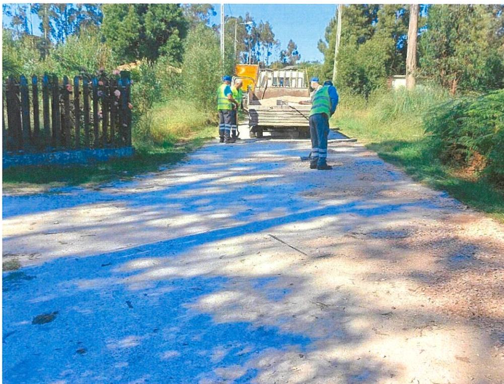
Manutenção na Rua Capitão Cancelinha