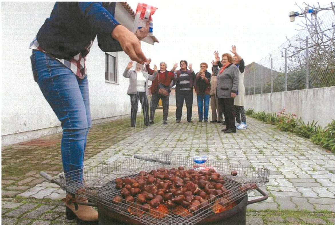
Fórum da Maioridade – Magusto com os Mais Idosos

Representação no Magusto do Fórum da Maioridade – O Presidente da Junta, acompanhado pelo seu Secretário, participaram a convite da Camara Municipal, no magusto que aconteceu no Fórum da Maioridade no passado dia 11 de novembro. Bom momento de partilha e de confraternização com os mais idosos, que participam em diversas atividades que acontecem naquele espaço, onde a vida ferve a um ritmo adequado, a quem teima em a prolongar, com hábitos saudáveis. Não faltaram as castanhas e a jeropiga doce, para aquecer a alma de todos os que por lá passaram. É sempre um privilégio poder ouvir de viva-voz, as extraordinárias histórias de vida com que os mais idosos nos brindam.