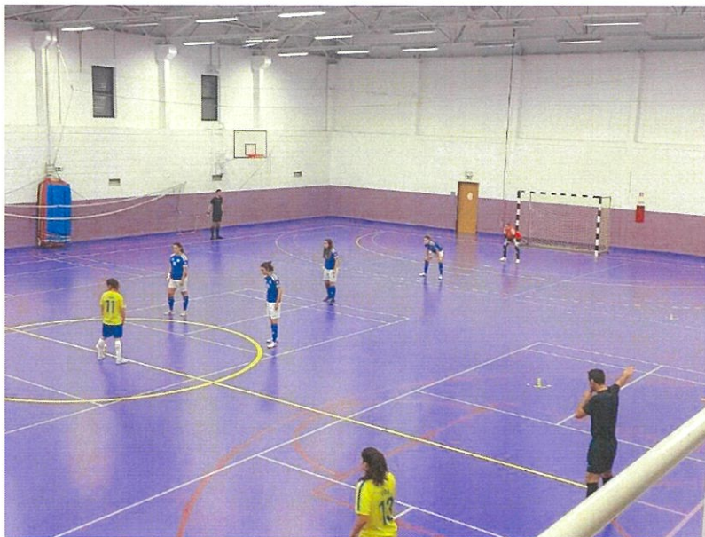
Equipa Feminina Sénior do Futsal do Grupo Desportivo do Gafanha

Representação no Futsal do Grupo Desportivo do Gafanha – O Presidente da Junta de Freguesia, a convite da Direção do Futsal do Grupo Desportivo do Gafanha, esteve presente no primeiro jogo oficial da época disputado em casa, pela Equipa Feminina de Futsal. Jogando contra o Gondomar, equipa muito forte para as nossas cores, que conseguiram honrosamente estar à frente no resultado em grande parte da partida, acabando por perder no final da mesma. De qualquer modo, ficou bem patente o excelente ambiente que reina no seio da Equipa, que seguramente a levará a conseguir os excelentes resultados, que a guindaram a este patamar. Continuaremos a tudo fazer, para que com o nosso pequeno contributo, possamos continuar a potenciar estas atividades físicas e saudáveis, aliadas à competição e na promoção do bom nome da Gafanha da Nazaré.