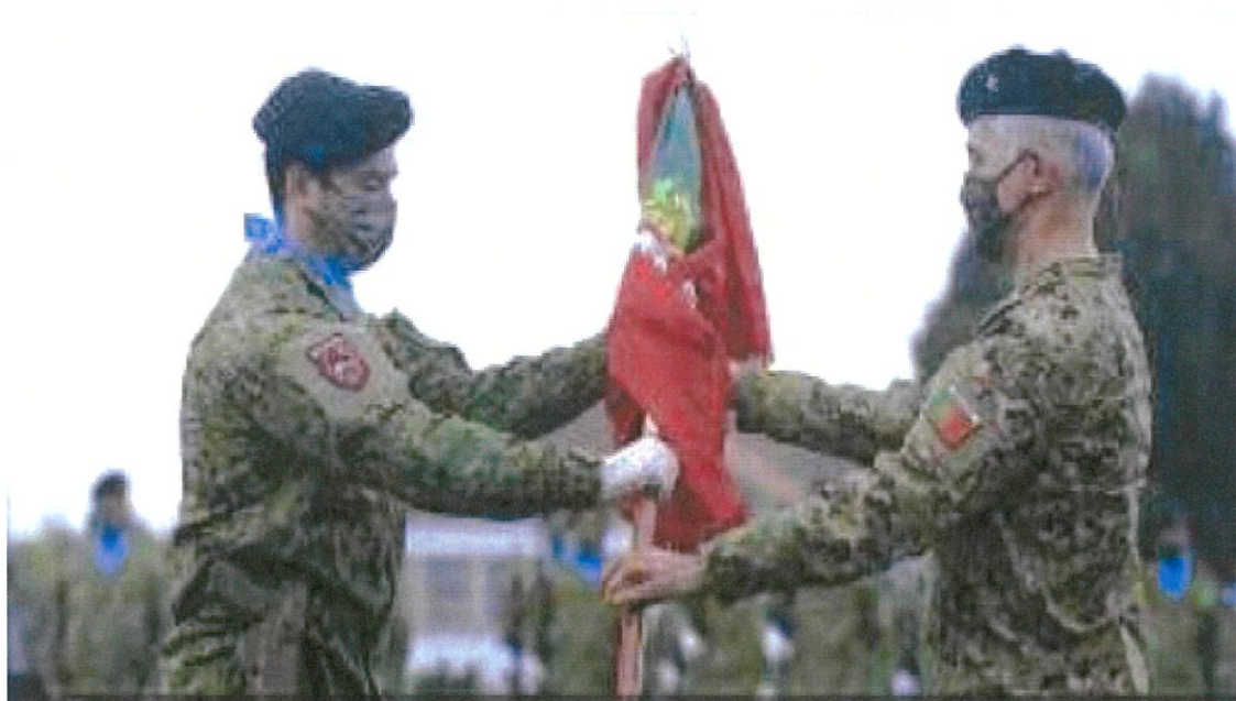
Momento da Entrega do Estandarte Nacional

Por último e não menos importante, a convite de sua Ex a O General Chefe do Estado Maior do Exército, José Nunes da Fonseca, o Presidente da Junta, marcou presença na Cerimónia de Outorga do Estandarte Nacional à 11 a Força Nacional Destacada (Conjunta)/ MINUSCA, que foi realizar uma missão de seis meses na República Centro Africana, em contexto muito difícil, na tentativa do estabelecimento da paz daquela região. Este dia teve momentos particularmente relevantes, nomeadamente a deposição de uma coroa de flores no monumento ao Paraquedista, a Integração do Estandarte Nacional na Guarda de Honra, a Apresentação das Forças em Parada, a revista às Forças em Parada, a Alocução do Excelentíssimo General CEME e a Outorga do Estandarte Nacional à 11 a Força, que os acompanhará em toda a missão. No final foi feita uma foto de grupo, com todos os Convidados e Militares das Forças que partiram para longe dos seus em defesa da Pátria e no honrar dos compromissos internacionais assumidos por Portugal.