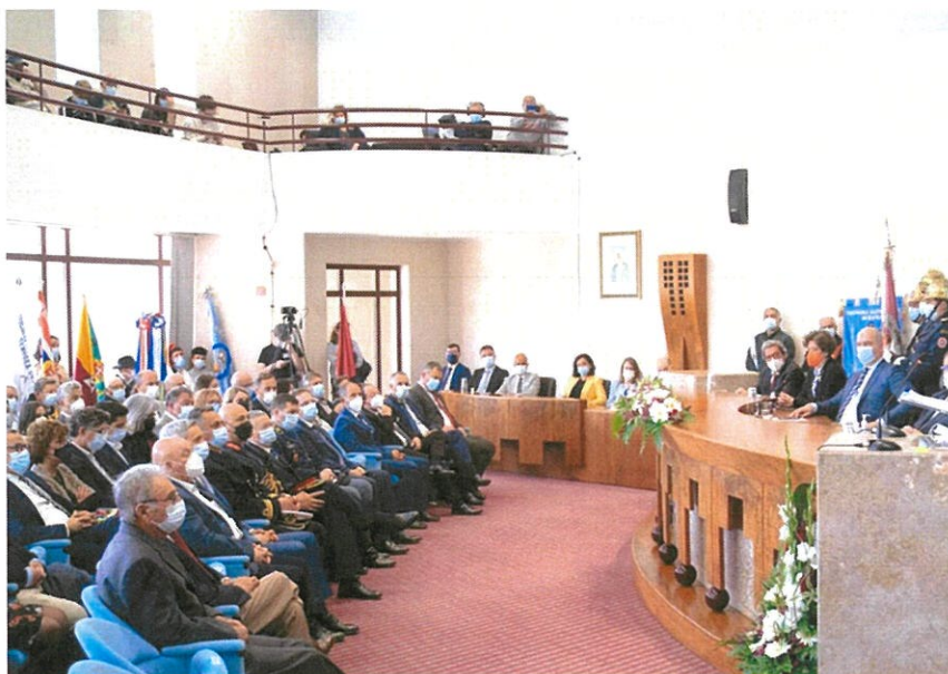
Sessão Solene, no Salão Nobre da Câmara Municipal de Ílhavo

Dia 18 de abril de 2022, assinalou o dia do Feriado Municipal, que foi celebrado na Sede do Município, mantendo a tradição.