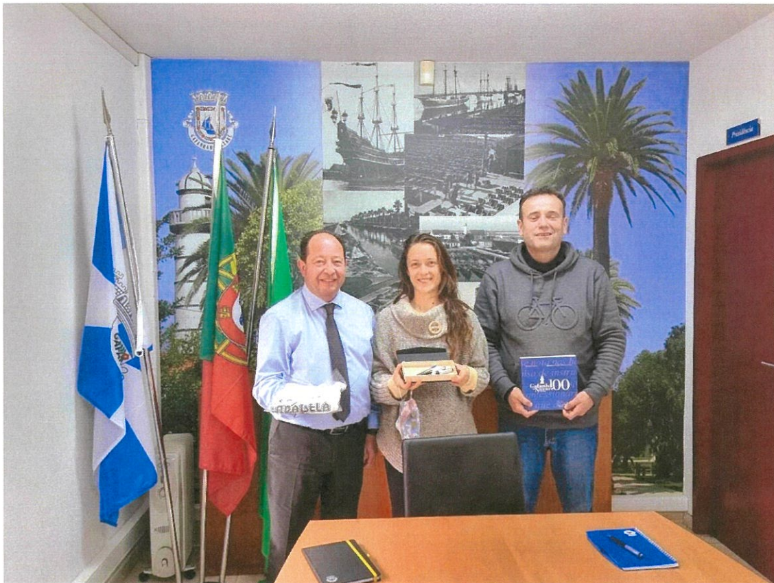
Freguesia da Gafanha da Nazaré e União Freguesias ST a Iria Azoia, S. João da Talha e Bobadela