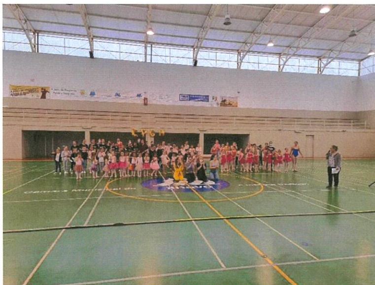
Sarau da Casa do Povo

No dia 1 de maio, o Presidente da Junta de Freguesia, representou a mesma, no Sarau da Casa do Povo da Gafanha da Nazaré, que decorreu no Pavilhão da Gafanha da Encarnação. Mais de 2 horas de demonstração de trabalho de grande qualidade, levado à prática, quer por Dirigentes, quer por Atletas, quer por Professores e também pelos Familiares dos Atletas. A simbiose que se vive no seio daquela família, é qualquer coisa de fantástico e orgulha-nos profundamente, enquanto parceiros desta Associação, a forma como estão comprometidos em fazer bem, mas sempre com o foco em fazerem cada vez melhor, dignificando de forma superior a Gafanha da Nazaré.