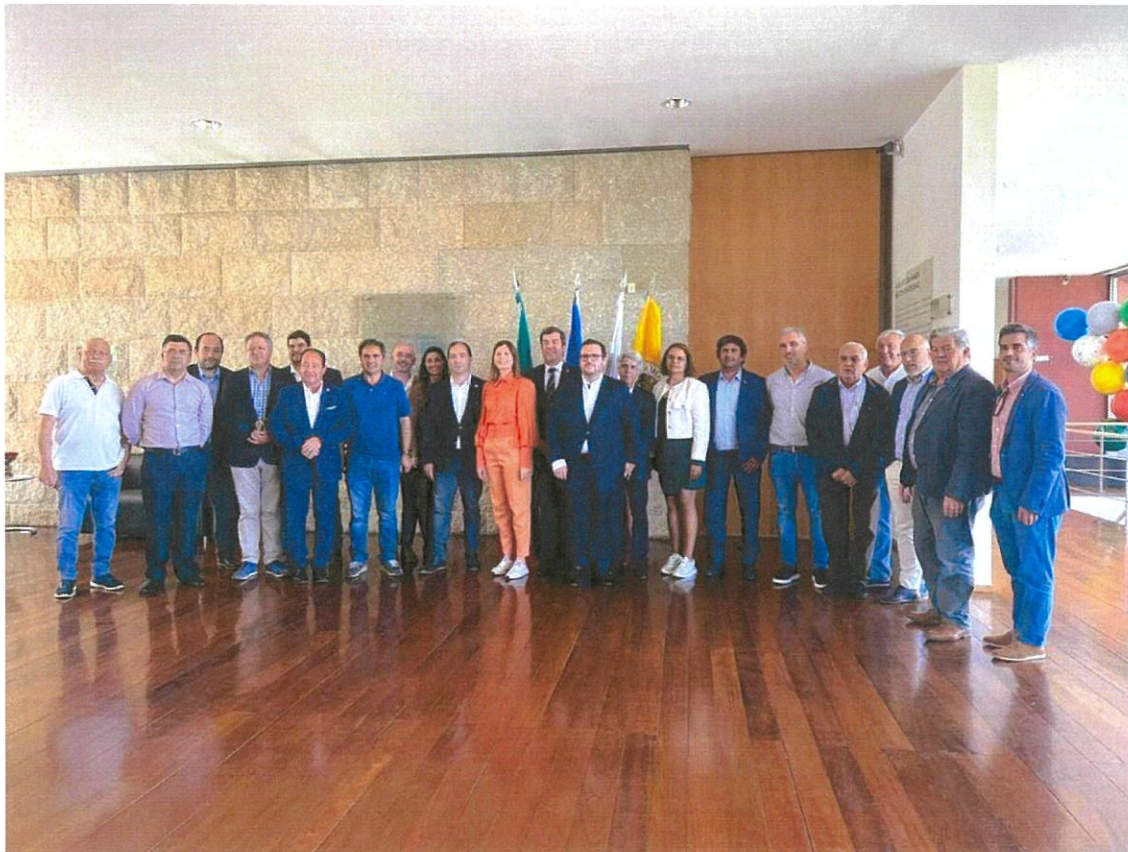
Equipas Cessante e Empossada da ANAFRE Distrital

O desempenho ao longo dos últimos quatro anos naquela Estrutura, permitiram uma imensurável aprendizagem do processo autárquico e deixaram muitas portas abertas, muitas amizades, e acima de tudo uma clarividência muito mais assertiva na visão e na gestão da vida autárquica. Partilhar saber e o conhecimento, tornam-nos mais abertos, com horizontes mais largos e com processos mais assertivos para o nosso dia a dia na gestão das autarquias que lideramos. Como é valioso poder fazer parte de Grupos de gente em que a partilha nos faz crescer todos os dias. Desejamos de forma veemente os mesmos sucessos aos que agora assumiram funções.