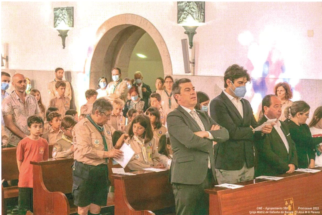
Momento das Promessas dos Nossos Escuteiros do Agrupamento 588

Depois deste momento, seguiu-se um pequeno lanche oferecido pelo Agrupamento, que foi mais um momento de partilha e alegria, onde o Presidente da Junta Já não pôde estar, por outros compromissos da Junta.