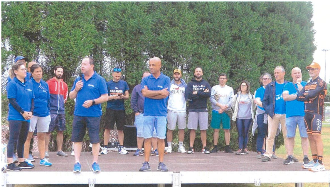
Sessão de Abertura do Gafanha da Nazaré Mexe Contigo

conjunto grande de atividades físicas e lúdicas, com o objetivo de colocar a Gafanha da Nazaré a Mexer. Um enorme sucesso, a repetir.