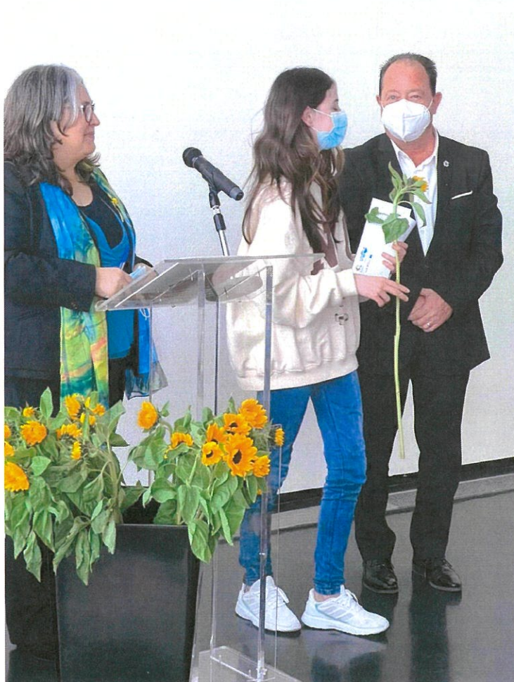
Momento de Entrega do Certificado à Filha de Agraciado que não pôde estar presente

Foram entregues, numa cerimónia muito singela, mas muito empolgante e emotiva, os Diplomas a adultos que obtiveram a sua certificação através do Centro Qualifica do Agrupamento de Escolas da Gafanha da Nazaré. A Exma. Diretora do AEGN e da Exma. Coordenadora do Centro Qualifica, o Presidente da Junta, esteve na entrega destes Diplomas, aos adultos com o seu percurso concluído com sucesso. A resiliência, a disponibilidade, a vontade de querer saber mais e de ter mais competências, a experiência de vida de cada um dos agraciados, fizeram deste momento um momento muito especial, que nos ensinou a todos, os presentes, que nunca é tarde para se aprender e que desistir ou baixar os braços, nunca é solução. Honra e Mérito aos Alunos, aos Professores, à estrutura do Centro Qualifica e à Direção do Agrupamento de Escolas, que concretizaram as condições para que este processo, com tanta complexidade chega-se ao final e com, o grande sucesso que lhe é reconhecido. Nunca é tarde para aprender, nunca é tarde para partilhar conhecimento, nunca é tarde para se procurarem mais e melhores competências. No processo evolutivo da vida, desistir não é opção. Obrigado por nos continuarem todos a proporcionar momentos destes e a darem-nos estas grandes lições de vida. Bem-haja.