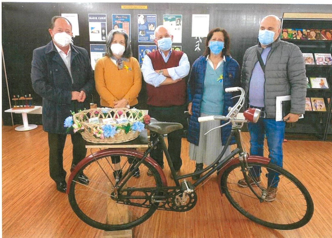
Entrega dos Valores Recolhidos na Escola na Parceria com a Junta de Freguesia

Solidariedade e objetividade é o nosso compromisso, para estarmos um passo à frente na defesa dos mais vulneráveis, seja por que razão for, que o justifique.