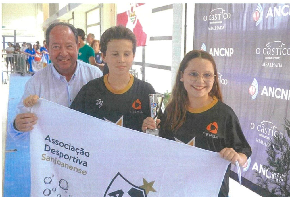
Momento da Entrega de Pr mios a Uma das Equipas Participantes no Campeonato

Decorreram na Piscina Municipal da Gafanha da Nazar , nos passados dias 14 e 15 de maio, as provas referentes ao Campeonato Regional de Clubes, tendo sido a responsabilidade de toda a organiza o t cnica e log stica do CAPGE. Esta organiza o, contou com a participa o de 15 Equipas dos Distritos de Aveiro e Viseu e envolveu cerca de 200 Atletas. A convite da Associa o de Nata o do Centro e do Norte de Portugal, o Presidente da Junta marcou presen a durante os dois dias em alguns momentos das provas, assim como na Cerim nia final da entrega dos pr mios aos Atletas e Equipas participantes. O brilhante terceiro lugar por equipas, obtido pelo CAPGE, que conseguiu 13 novos recordes pessoais, 6 novos recordes do Clube e a vit ria individual em 4 provas, denota bem a qualidade de trabalho dos seus atletas e dos seus t cnicos, assim como da Dire o do Clube. S o momentos como estes, que nos impellem, em continuar a ser parceiros das nossas Associa es que tanto nos dignificam e que t o bons resultados produzem.