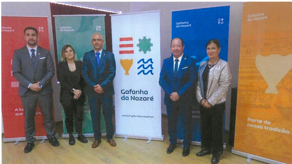
Executivo da Gafanha da Nazaré com a Nova Imagem da Freguesia da Gafanha da Nazaré

O início do Funcionamento da APP , já com um conjunto importante de módulos que ficaram disponíveis aos Cidadãos, permitindo-lhes interagir de forma mais fácil e rápida com os serviços da Freguesia. Por último, o lançamento de um projeto novo para a Freguesia, na iniciativa, " Gafanha da Nazaré MEXE CONTIGO ", que congrega mais de vinte Associações e Entidades da Freguesia, com atividades nas mais diversificadas modalidades, culturais, lúdicas e desportivas e que nesta primeira edição, juntou mais de 700 participantes. Um sucesso a repetir porque os muitos participantes e Entidades parceiras, isso mesmo nos fizeram sentir.