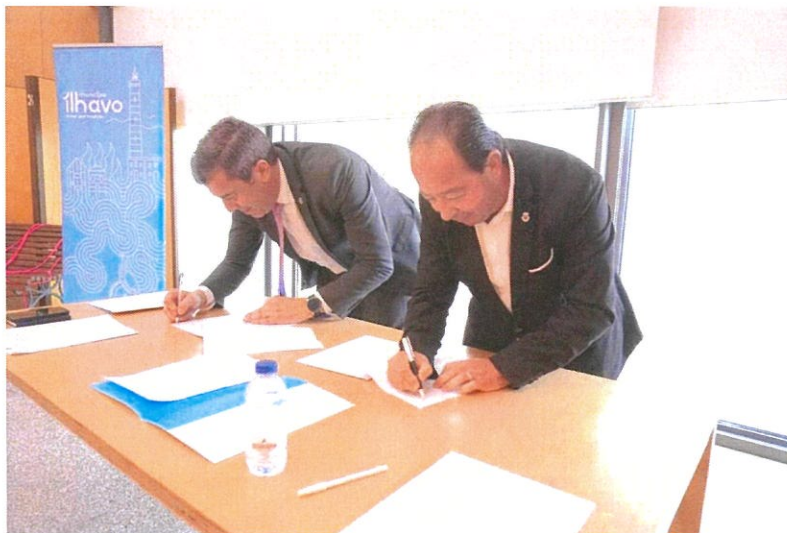
Momento da Assinatura do Acordo de Apoio Financeiro à Junta de Freguesia

Por tudo isto, este Acordo no final desta fase de implementação, deixa-nos muitas respostas por dar, adensa as nossas preocupações em relação à sua condição de execução e não nos deixa tranquilos. Tudo isto, foi transmitido a quem de direito e uma certeza nós temos, o Executivo da Gafanha da Nazaré não colocará em risco a sua condição financeira, estável e perfeitamente controlada, sob pena de ficarem obras por executar, caso não se venham a verificar os reforços necessários aos ajustamentos que vão ter que ser feitos, tal como foi afirmado, quer pelo Sr. Vereador das Freguesias, quer pelo Sr. Presidente da Câmara no dia das assinaturas dos Acordos.