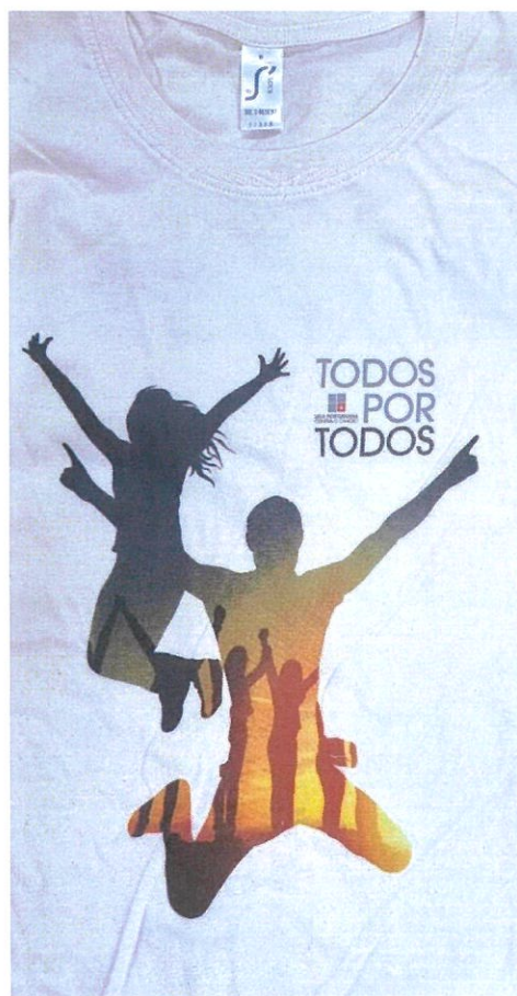
Imagem da T. Shirt entregue aos Participantes na caminhada

Por todos estes motivos, a nossa participação, por muito pequena que seja, será sempre muito relevante.