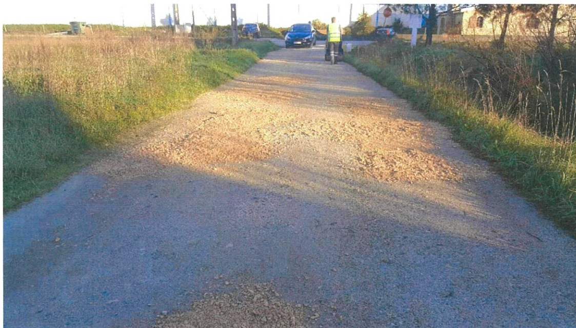
Manutenção na Rua Capitão Cancelinha