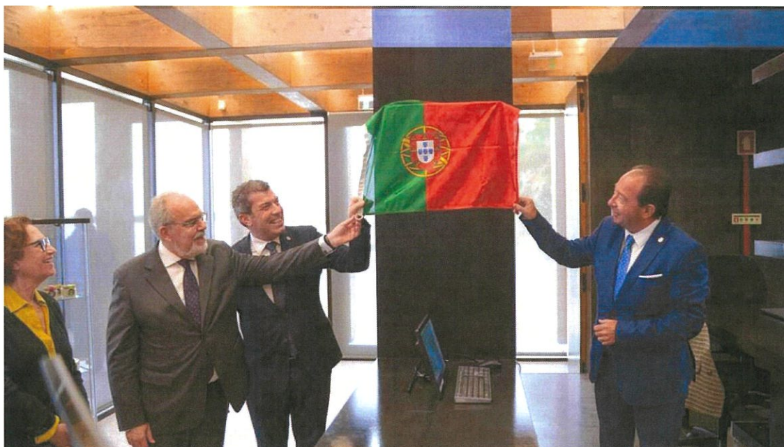
Momento do Descerrar a Placa alusiva ao Momento na Receção do Navio Santo André