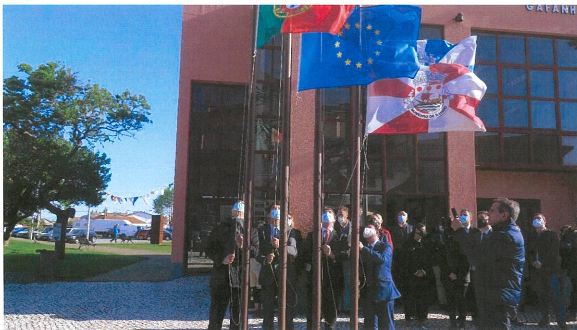
Momento do Hastear das Bandeiras no 21 Aniversário da Elevação a Cidade

Ainda na manhã de 19 de abril, seguiram-se visitas às obras em curso na Freguesia, provenientes do mandato do anterior Executivo camarário, nomeadamente à Rua S. Francisco Xavier 1.ª fase e ao Navio Museu Santo André.