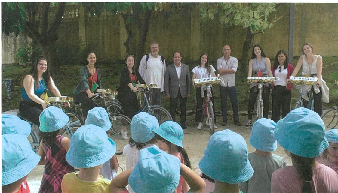
As Máquinas (Bicicletas Pasteleiras) Transformadas e Preparadas para Saírem para a Rua

Na passada sexta-feira, 3 de junho, Dia Mundial da Bicicleta, aconteceu nas Ruas da Cidade de Aveiro, entre as 10 e as 13 horas, uma deambulação musical sobre rodas, protagonizada por um grupo de alunos da Licenciatura de Música (DTFM) da Universidade de Aveiro. Esta ação que é em primeira instância um projeto artístico, leva-nos a desafiar a criatividade para que a música possa ser uma experiência de partilha com a população numa deambulação real e metafórica por territórios sonoros e espaços da cidade. A Garagem da Universidade de Aveiro, tem sido ao longo das últimas semanas, dado que o projeto começou em maio e vai até ao início de julho, um laboratório criativo de experiências únicas para Professores e Alunos. São ainda Parceiros deste projeto, para além da Universidade de Aveiro e da Junta de Freguesia da Gafanha da Nazaré, a Escola Secundária da Gafanha da Nazaré, a Ciclaveiro e a Design Factory.