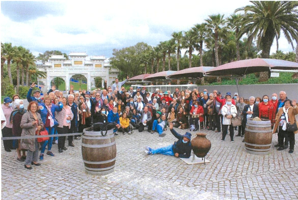
Grupo de Cidadãos Participantes no Passeio "LONGEVIDADE"

No Buddha Éden Parque, degustaram um almoço, de pratos tradicionais da zona da Estremadura, dos bons vinhos da casa Bacalhoa e fizeram a visita ao Parque, tendo à disposição os mais debilitados, um Comboio turístico para fazerem essa mesma visita. Foi um dia marcante, de grande diversão e companheirismo, que deixou com grande vontade dos participantes, que momentos como estes possam ser repetidos, com mais frequência relevando o muito agrado pela forma como tudo foi organizado. Uma palavra de muito apreço, para os Bombeiros Voluntários de Ílhavo, que nos acompanharam em todo o percurso, dando o seu conforto a toda a comitiva, sempre atentos e precavidos para o que desse e viesse. O regresso à Gafanha da Nazaré, aconteceu já perto das 20 horas com toda a comitiva em segurança e animados.