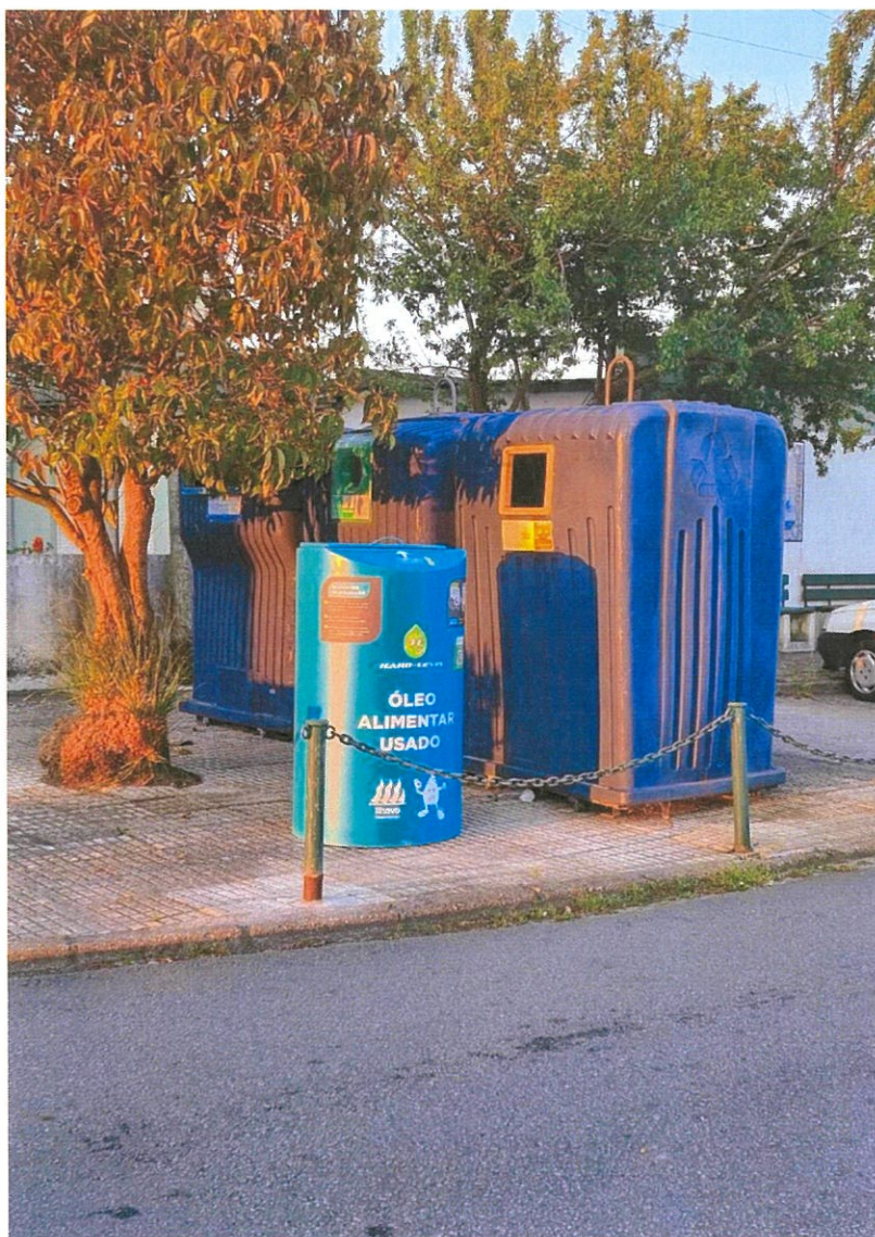
Novos Recipientes colocados na Freguesia da Gafanha da Nazaré

No passado dia 4 de maio, começaram a ser colocados na Freguesia, mais um conjunto de 9 recipientes para a colocação de óleos de utilização doméstica usados. Num trabalho conjunto da empresa HardLevel – Energias Renováveis, Câmara Municipal de Ílhavo e Junta de Freguesia da Gafanha da Nazaré, definiram-se locais para a colocação destes equipamentos, que abrangem toda a área geográfica da Freguesia. Num trabalho para a seleção dos locais, feito pela Junta de Freguesia, que também se disponibilizou para a eventual execução das bases para os mesmos, demos uma vez mais o nosso forte contributo, para cuidar do ambiente. De louvar o investimento nos equipamentos, totalmente assegurado pela HardLevel, que desta forma reflete as preocupações ambientais, conjuntas com a Eco Freguesia da Gafanha da Nazaré, tanto mais, que depois de recolhidos estes óleos, seguem para um processo de reciclagem e reaproveitamento.