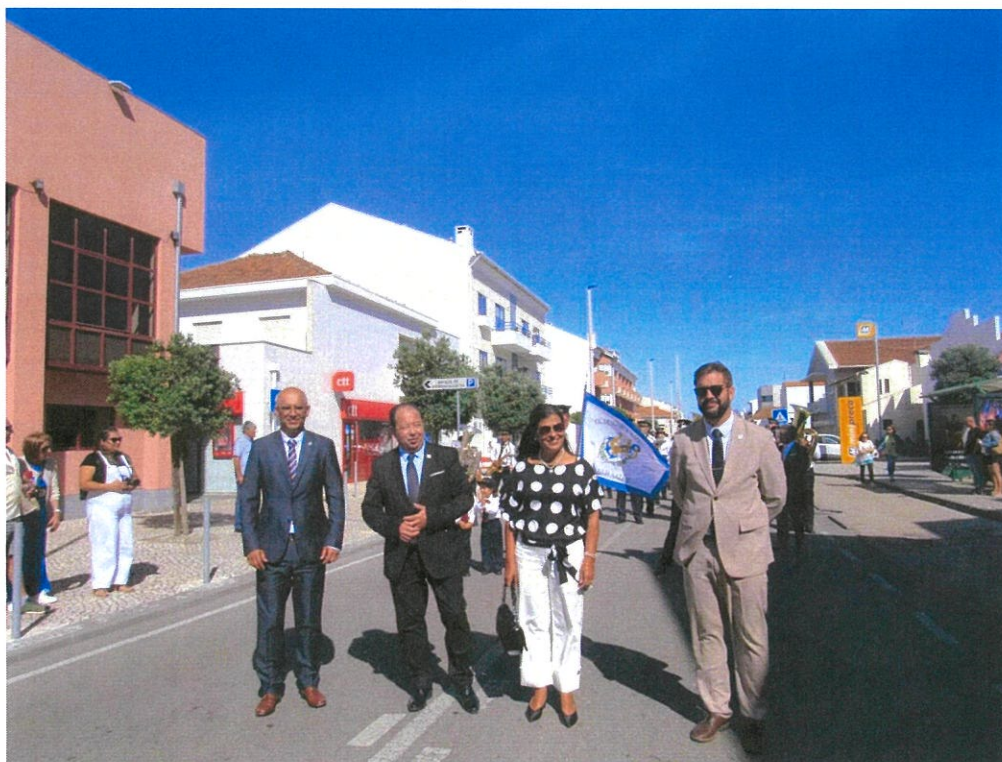
Membros do Executivo nas Festividades da N a Sr. a da Nazaré