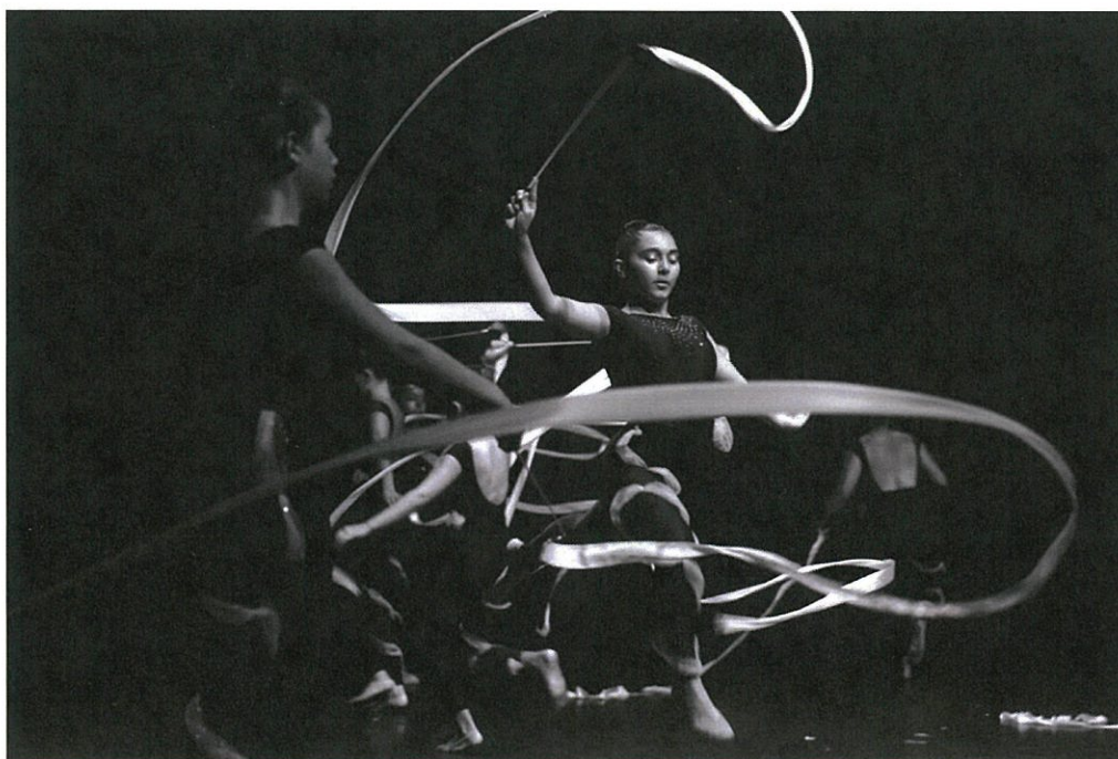
Momento do espetáculo "RAÍZES"