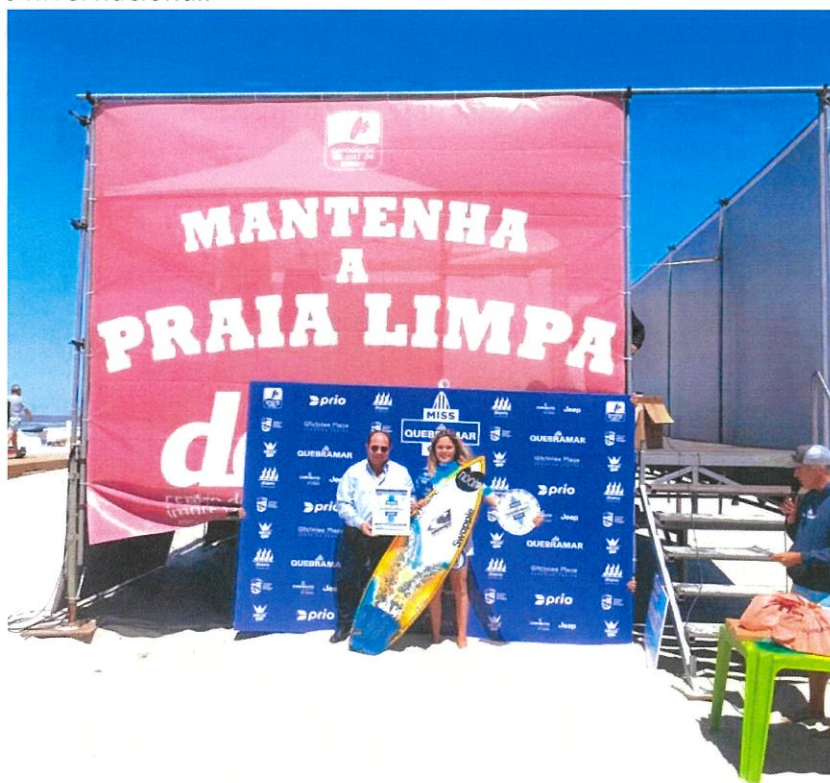
Entrega de Prémios às Vencedoras