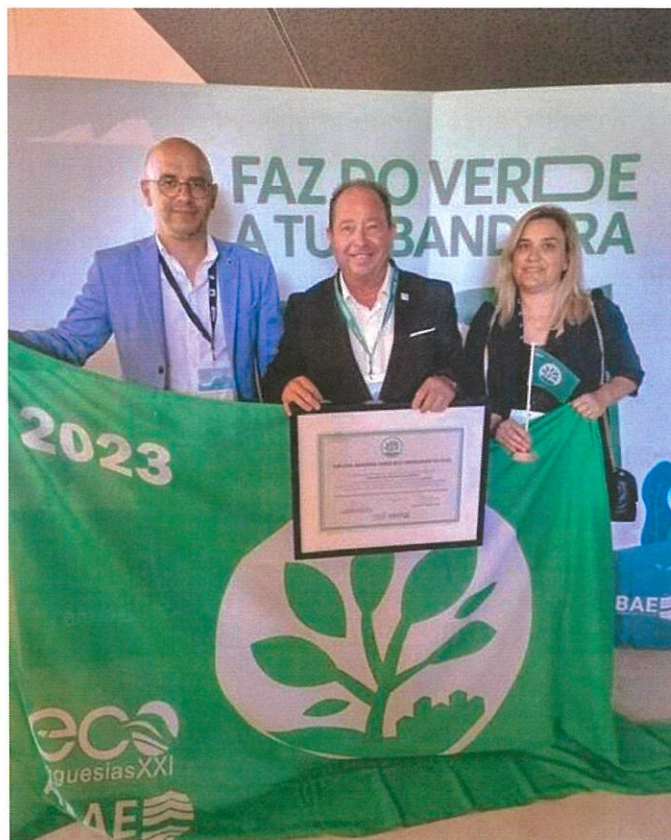
Galardão Bandeira Verde Eco Freguesia XXI, 2023

A nossa comunidade constrói-se com a ajuda e participação de todos. Os efeitos e consequências das alterações climáticas estão à vista de todos e é nossa responsabilidade contribuir, mesmo que seja com pequenos gestos e práticas simples, para um futuro melhor. O Futuro que já começou e não podemos deixar de o acompanhar.