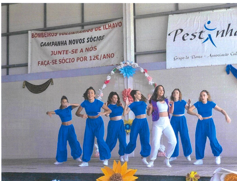
Sarau das “Pestinhas”