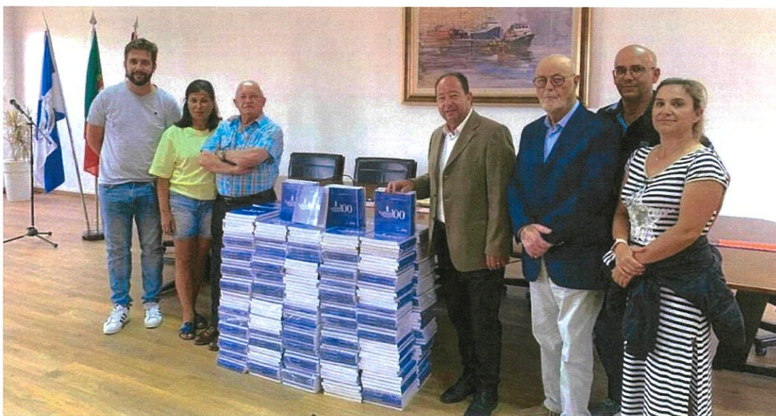
Momento da Entrega dos Livros à Paróquia.

Preservar a Identidade dos Gafanhões é respeitar o nosso passado, viver o presente e salvaguardar o nosso futuro coletivo.