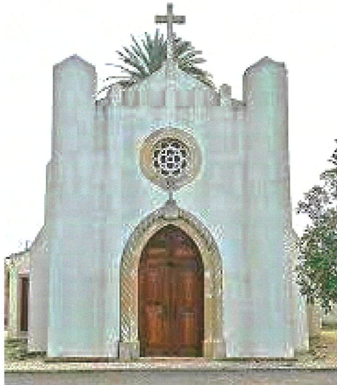
Capela da N.ª Sr.ª dos Navegantes

De ano para ano, as dificuldades para organizar este evento marcante na Freguesia da Gafanha da Nazaré e na Ria, são cada vez maiores. O esforço hercúleo que o Grupo Etnográfico continua a fazer, está a perder cada vez mais a condição de ser realizado. A falta de apoios por parte de quem deve apoiar e a pouca valorização de um evento, que implica muito trabalho e muita exigência financeira para ser realizado, se assim não for entendido, não terá condição de continuar no futuro. Só Esforço de algumas Entidades, ainda continua a manter este evento vivo, que se realiza ininterruptamente há mais de meio século. A Capela em Honra da Nossa Senhora dos Navegantes, que começou a ser construída em 3 de dezembro de 1863, é porventura o templo religioso mais antigo da Freguesia da Gafanha da Nazaré e foi erigido em honra dos pescadores e dos mareantes que navegam em mares do mundo. O Grande impulsor, no retomar deste evento, o Padre Miguel Lencastre, deixou-nos este legado que não podemos perder. Não podemos por toda esta história e fervor religioso, deixar de dar os parabéns ao Grupo Etnográfico da Gafanha da Nazaré, pela teimosia que tem mantido, no realizar destas festividades, em que o marco maior é a Procissão na Ria. Ao não se realizar este ano, por questões de segurança para os que nela participam, foi um ato de consciência e de coragem por parte do Grupo Etnográfico. Obrigado, Grupo Etnográfico.