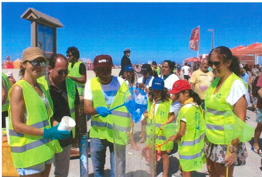
Momento na recolha das Beatas

Agradecemos a participação de todos os voluntários e esperamos que com esta ação de sensibilização ambiental, se consiga reduzir ainda mais, o número de beatas e lixo no areal.