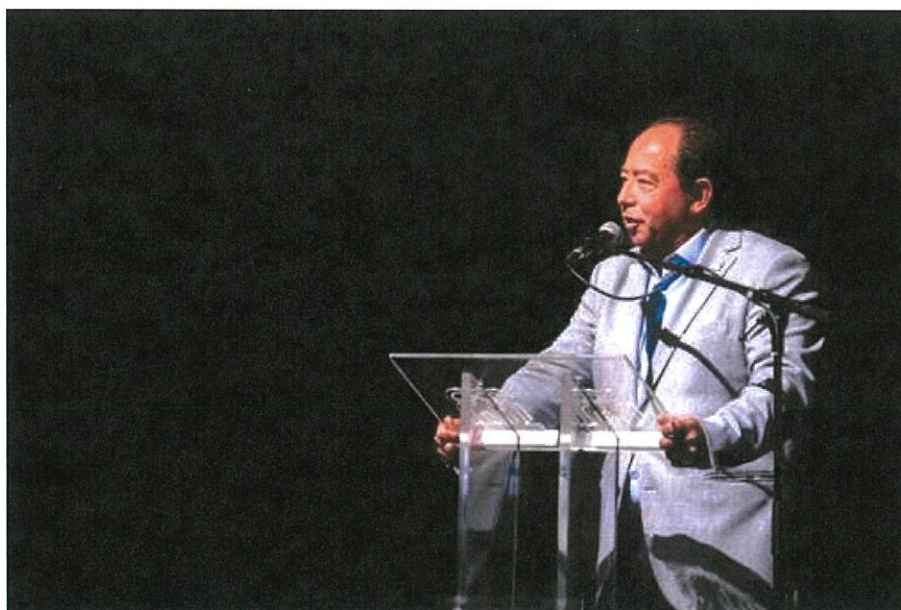
50 Gala da Casa do Povo da Gafanha da Nazaré

O Espetáculo associado à Gala dos 50 Anos, foi de uma beleza fantástica, sendo que, todos os momentos, foram potenciados por atletas que trabalham à mais ou menos tempo na Instituição. A Casa do Povo da Gafanha da Nazaré, é hoje uma das Associações mais representativas da Freguesia da Gafanha da Nazaré, do Concelho de Ílhavo e de grande relevância a nível nacional. Mas nem tudo são rosas..... pena que a Fábrica das Ideias, não tivesse sala esgotada para testemunharem tão grande qualidade e tanto empenho para com a comunidade onde estão inseridos. Continuamos a teimar, ficar em casa e não valorizar quem tanto de si dá, em prol dos outros.