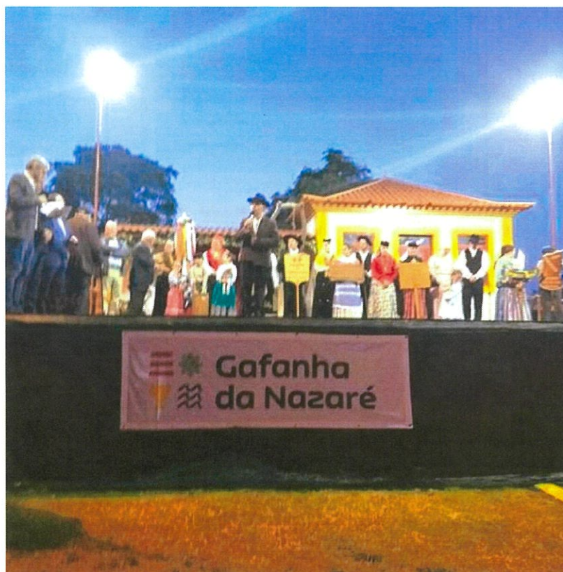
Grupo Etnográfico da Gafanha da Nazaré