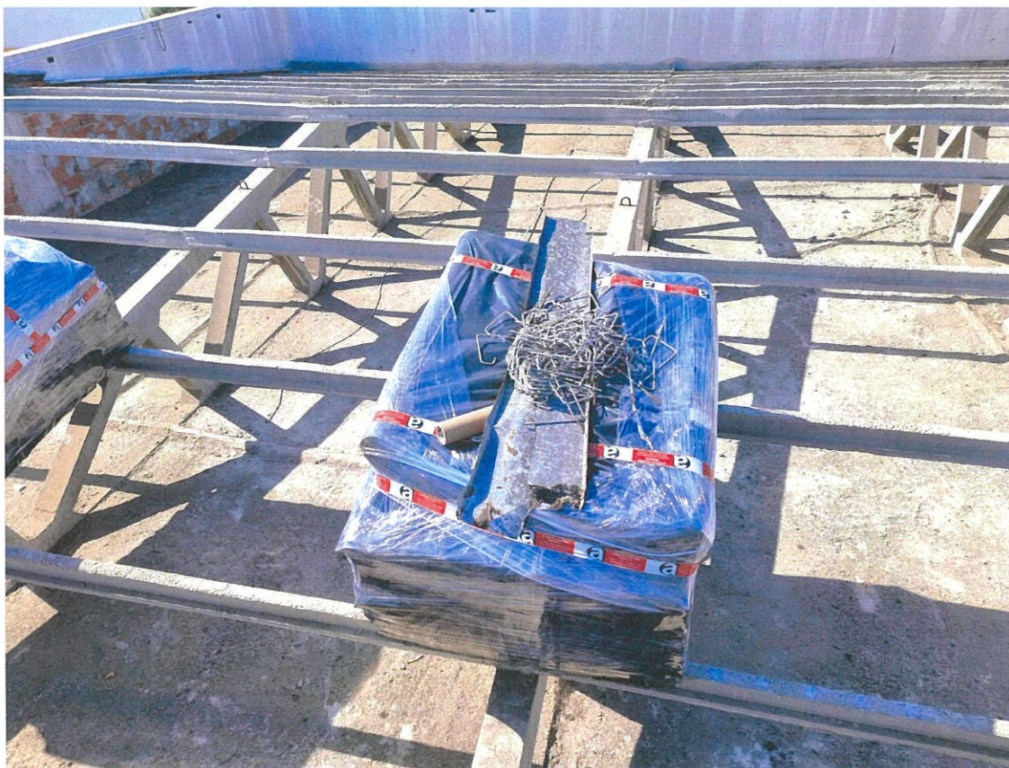
Amianto do telhado devidamente acondicionado, depois de retirado

As obras inscritas para o ano de 2023, no Contrato Interadministrativo, estão a desenrolar-se a bom ritmo. Das cinco obras contratualizadas, uma e a mais complexa de todas, já está concluída. A substituição do telhado do edifício Sede da Junta de Freguesia. A Capela das Almas no Cemitério, já tem também o telhado substituído, assim como a pintura exterior executada. Contamos até ao final de outubro ter a parte interior concluída, com o restauro da zona do altar e a pintura interior, assim como a do pavimento. Quanto à iluminação no Cemitério, falta apenas colocar os candeeiros no lugar onde cada um deles vai ser colocado, estando já comprados e em nossa posse. Quanto aos dois tramos de passeio a concretizar, ainda não temos todos os problemas resolvidos com a Câmara de Ílhavo. Projetos muito diferentes do previsto inicialmente, orçamentos fora dos valores negociados, devido às alterações dos projetos, levaram a que tivéssemos de anular, já, dois ajustes diretos. Temos, no entanto, a convicção, de que nove meses, depois do início do ano, devido a todas estas vicissitudes, poderemos depois de reformuladas as obras, chegar a bom porto, para executarmos pelo menos um dos passeios. O diálogo tem sido intenso com a Câmara, no sentido de ultrapassarmos as questões pendentes com estes dois processos. Seguramente que será entendimento da Junta de Freguesia da Gafanha da Nazaré e da Câmara de Ílhavo a prorrogação do prazo de conclusão destes tramos de passeios, para o ano de 2023.