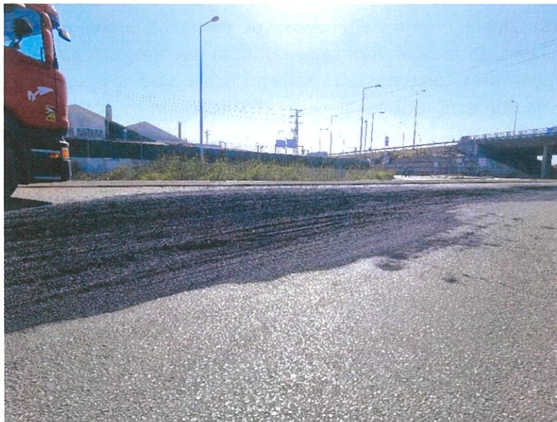
Aspeto do derrame de petcock na via

Conclusão final. Apesar das determinações e das regras definidas para alguns procedimentos, concluímos que os mesmos não estão a ser cumpridos. Deixamos esta veemente preocupação, à Câmara Municipal de Ílhavo, à Administração do Porto de Aveiro e às Entidades Fiscalizadoras para que as ações de vigilância e controlo nestes procedimentos, sejam mais exigentes e efetivas.