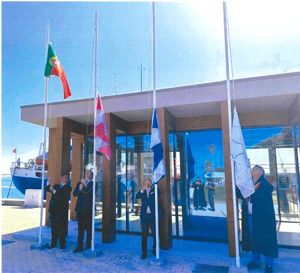
Hastear das Bandeiras no Momento de Abertura do Festival do Bacalhau

Decorreu entre 9 e 13 de agosto, mais uma edição do Festival do Bacalhau. A 14ª Edição deste evento, o mais emblemático do país, no que à gastronomia do Bacalhau diz respeito, ou não seja a Gafanha da Nazaré a Capital do Bacalhau, por excelência, tendo decorrido dentro da normalidade festiva e institucional que o evento exige. Replicando um formato de sucesso garantido, cabe, no entanto, à Câmara Municipal, Entidade organizadora do evento, acautelar algumas questões que nos parecem fundamentais. A questão dos preços praticados na área de restauração, (não fica barato em tempos difíceis, uma família de 4 ou mais pessoas fazer ali a refeição) e talvez por isso, este ano e em particular ao almoço, parece ter havido um decréscimo de visitantes, segundo dados da organização. As salas onde são servidas as refeições, deveriam ter equipamentos que produzissem uma melhor condição de temperatura ambiente, pois o grande número de pessoas dentro de cada sala, em contínuo, não traduz grande conforto. Sendo esta uma responsabilidade de cada Associação, num investimento tão elevado, poderia a Organização potenciar soluções para que este problema pudesse ser ultrapassado. Verifica-se no entanto, uma consciencialização grande e uma preocupação crescente, no sentido de proporcionar melhores condições a todas e todos os que nos visitam, o que é de relevar. Seguramente, que para o ano, haverá mais "Festival do Bacalhau, no Jardim Oudinot, na Gafanha da Nazaré.