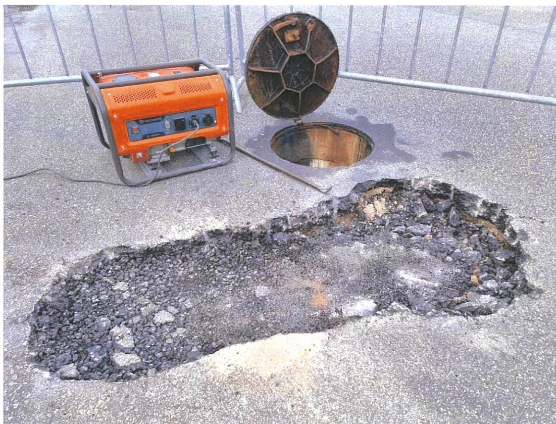
Reparação de um Abatimento