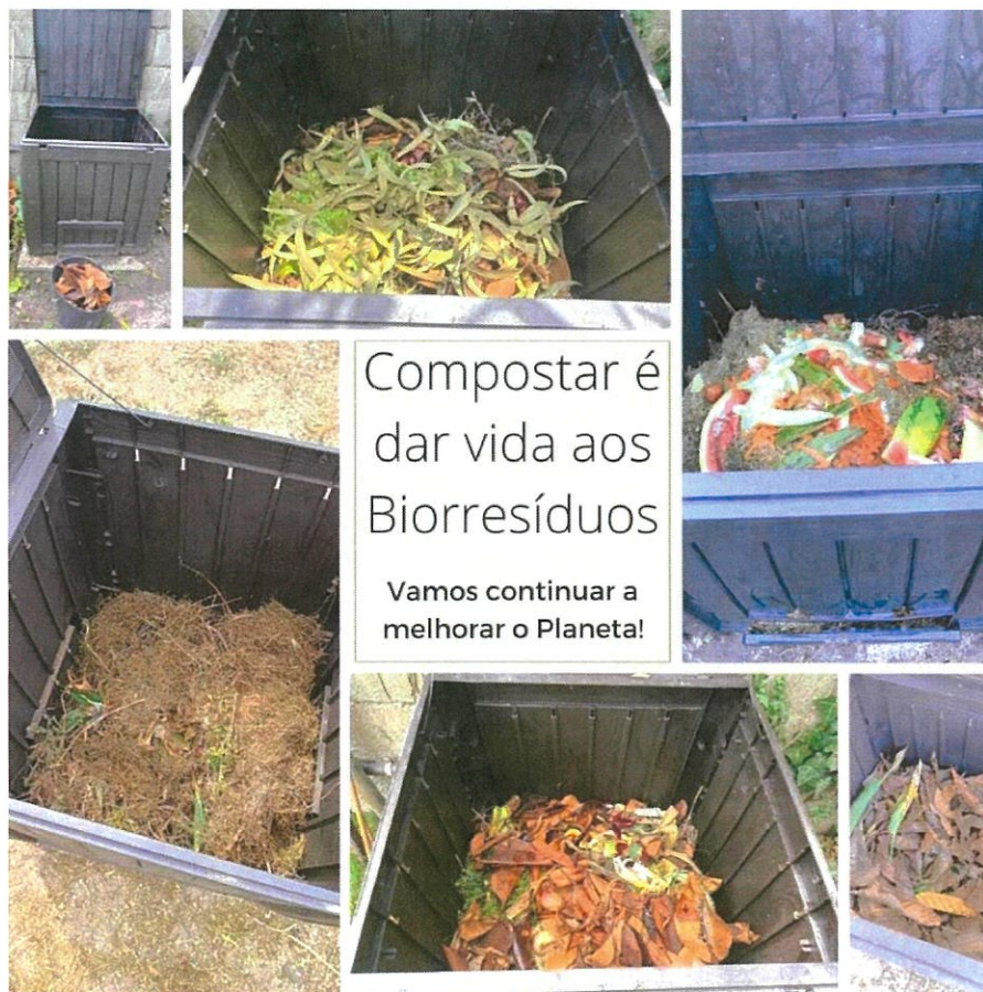
Aspetos da Compostagem em Vários Parceiros

Compostagem - Este processo da Compostagem, que sofreu um incremento enorme no passado dia 20 de abril, último, com a entrega por parte da Junta de Freguesia da Gafanha da Nazaré, de forma graciosa de 57 Compostores , a outros tantos utilizadores, está a ter um reflexo muito positivo, naquilo que eram as nossas pretensões. No acompanhamento periódico que vamos monitorizando, verificamos que as pessoas têm tido comportamentos consentâneos com o que é o processo da compostagem. Com esta iniciativa, a Freguesia retira aos contentores de RSU, largos quilos de matéria que assim é tratada e depois reutilizada noutros processos. Desta forma, contribuímos para um menor custo com o tratamento de resíduos e tratamos melhor o ambiente.